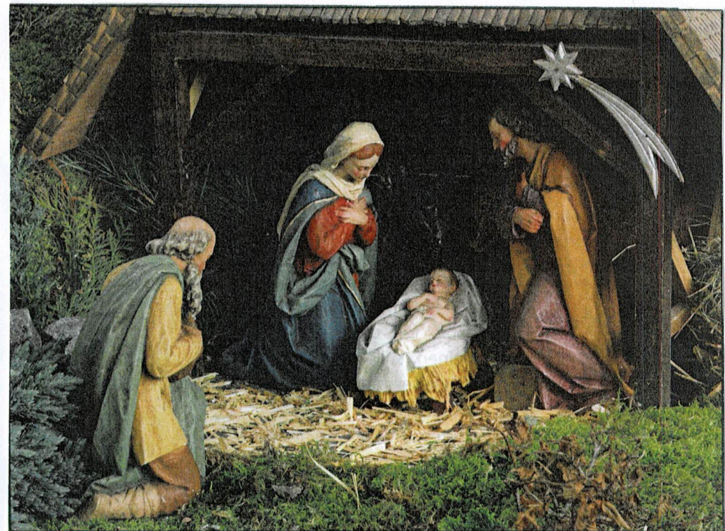
Gott wird Mensch